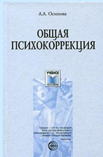
А.А.Осипова «Общая психокоррекция»