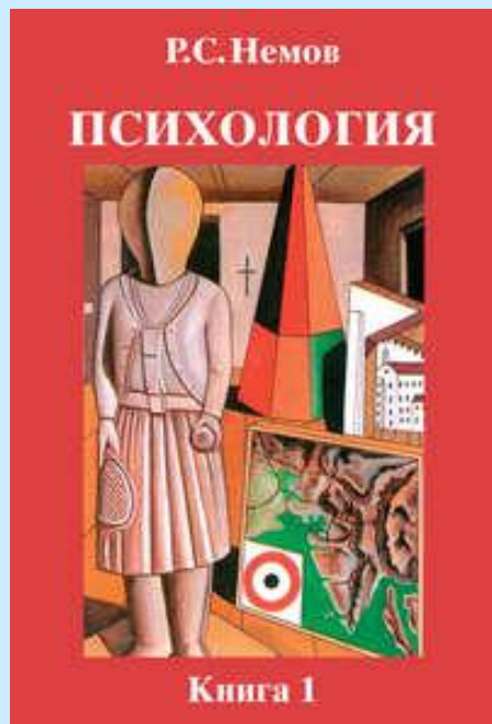
Р.С.Немов «Общие основы психологии»